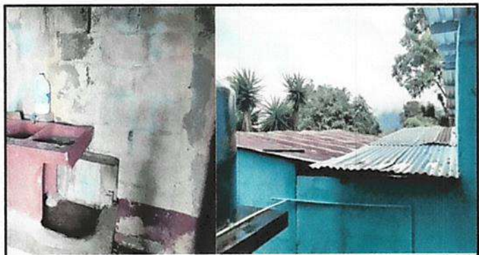
FOTO 6: ES NECESARIA LA RECONSTRUCCIÓN DE UNA PARED Y LEVANTADO DE ALTURA PARA CAMBIAR LA PENDIENTE DEL TECHO CAMBIANDO SU LÁMINA Y ESTRUCTURA QUE ESTÁ EN MAL ESTADO.

Observación: Si es necesario se pueden agregar hojas adicionales y actualizar el número de hojas.