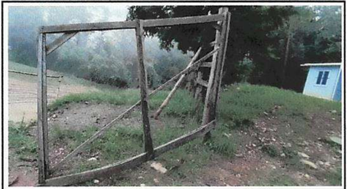
FOTO 2: EL PORTÓN ACTUAL ESTÁ INSERVIBLE, PERMITIENDO EL PASO LIBRE A LAS PERSONAS, ESPERANDO MEJORAR CON PORTÓN DE DOS HOJAS CON TUBO GALVANIZADO Y MALLA PARA CERCA.