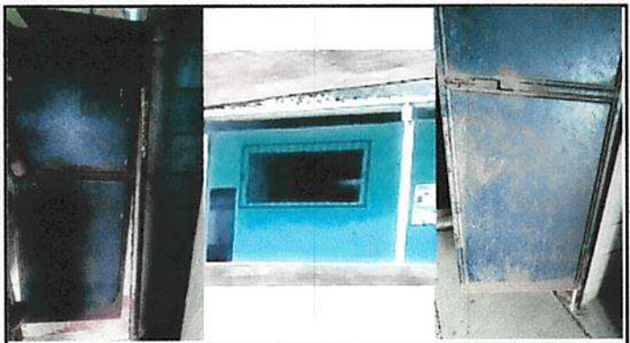
FOTO 4: LAS CUATRO PUERTAS DE LOS SANITARIOS ESTAN DESPRENDIDAS Y REQUIEREN MANTENIMIENTO ASI COMO LA COLOCACIÓN DE CUATRO VENTANAS EN LAS AULAS