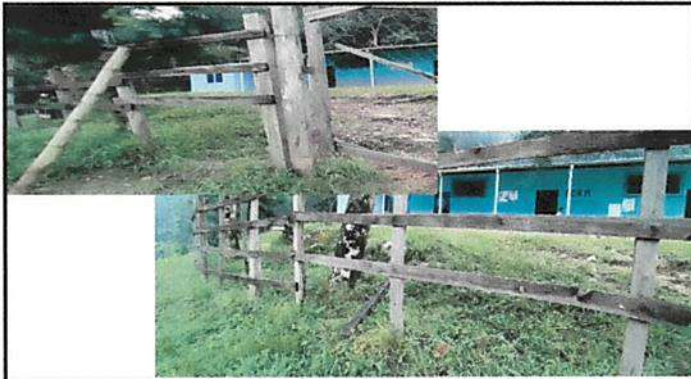
FOTO 1: LA ESCUELA NO CUENTA CON UNA BUENA CIRCULACIÓN, INGRESAN CON FACILIDAD ANIMALES Y PERSONAS AJENAS A LA MISMA, REQUIRIENDO COLOCAR MALLA PARA PROTECCIÓN DEL INMUEBLE.