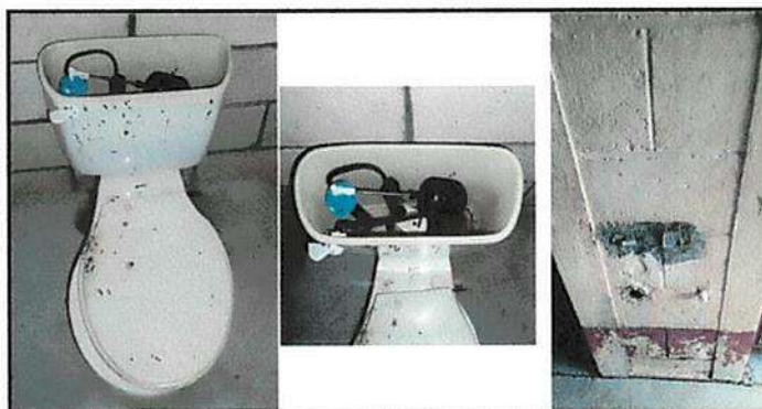
FOTO 5: LOS TRES SANITARIOS CUENTAN CON DESPERFECTOS EN EL SISTEMA DE LLENADO Y DESFOGUE DE TANQUE ASI COMO LA FALTA DE LAVAMANOS PARA LOS ALUMNOS.